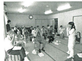
▲地域福祉活動の推進